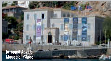
Ιστορικό Αρχείο Μουσείο Ύδρας