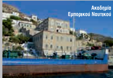
Ακαδημία Εμπορικού Ναυτικού