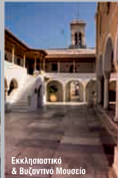
Εκκλησιαστικό & Βυζαντινό Μουσείο