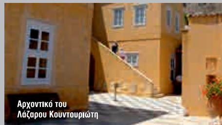
Αρχοντικό του Λάζαρου Κουντουριώτη